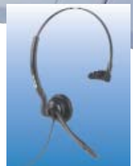
Mehr Freiheit beim Telefonieren: Das COMfort-Headset.

Die integrierte USB-Schnittstelle und das mitgelieferte Software-Paket COMsuite übernehmen zusätzlich vielfältige Datenkommunikationsaufgaben über CAPI und TAPI, z. B. Fax, Anrufbeantworter und EuroFile-Transfer sowie kanalgebündelten Internet-Zugang mit 128 KBit/s über den NDIS-WAN-Treiber. Im Klartext: ISDN-Kartenfunktionalität ohne zusätzlichen Hardware-Aufwand.